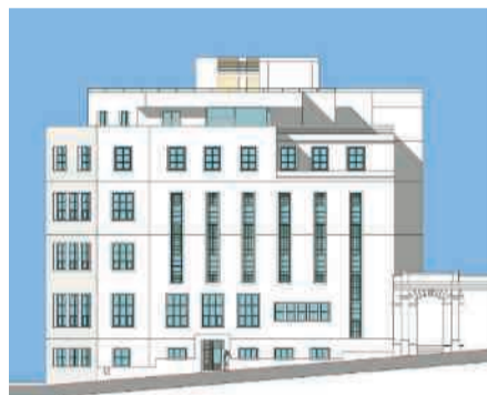
Rue de l'Est, ce bâtiment qui abritait un transformateur électrique deviendra un hôtel d'activités, où près de 200 personnes travailleront autour des jeux vidéo.

dissement, on compte déjà plus de 400 entreprises de jeux vidéo. En Europe, la France détient 60 % de l'industrie du jeu vidéo, et Paris occupe la deuxième place dans ce secteur après Londres. Nous avons donc tous les arguments pour pas-